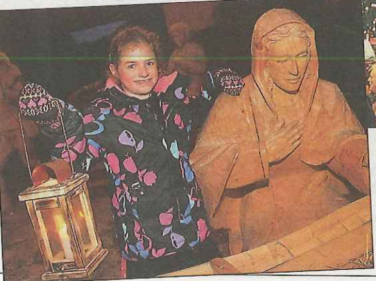
◀ In Strobl faszinieren auch lebensgroße Krippenfiguren die jungen Gäste.

Unser tägliches Service: Orte, Vereine und Institutionen, die ihre Veranstaltungen angekündigt haben wollen, mögen das Programm wenn möglich mit Foto schriftlich bekannt geben. Unsere Adresse: OÖ-Krone-Redaktion Wohin, Khevenhüllerstraße 31, Postfach 800, 4021 Linz; Fax: 0 732/77 12 90; e-mail: sekretariat-linz@kronenzeitung.at